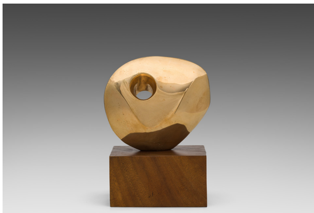
Barbara Hepworth (1903–1975) Pierced round form, 1959/60 Bronze H 22,5 cm (mit Sockel) Verkauft für CHF 192 000

Hervorzuheben sind auch die beiden Farbserigrafien von Andy Warhol ; das Porträt von Lenin fand bei 117 500 CHF einen Abnehmer und das zweite Werk, welches in vier Bildern die Symbole der kommunistischen Bewegung abbildet, wechselte für 100 000 CHF den Besitzer.