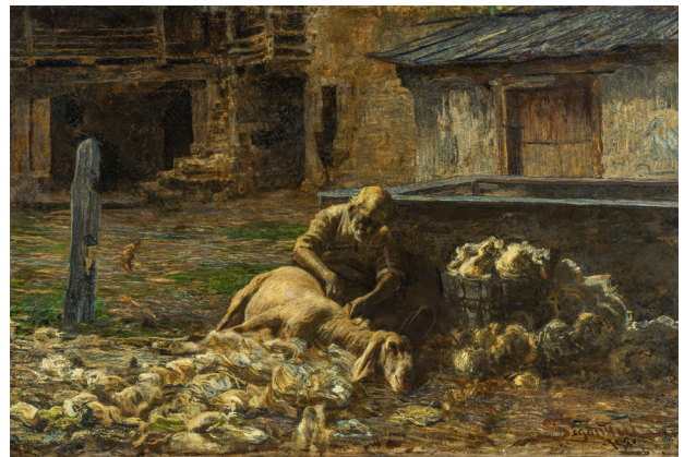
Giovanni Segantini (1858–1899) Il reddito del pastore, "Der Ertrag des Hirten", 1883/86 Öl auf Leinwand – 54,2 x 82,8 cm Verkauft für CHF 903 000

Eine weitere Skulptur, diesmal der amerikanischen Künstlerin Louise Nevelson , rief ebenfalls sehr viel Interesse bei den Bietern am Telefon und im Internet hervor. Die Louise Nevelson Skulptur wurde schliesslich, weit über ihrer oberen Schätzung von 40 000 CHF, für 186 000 CHF verkauft.